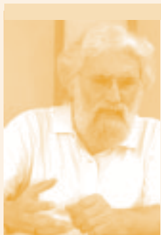
Leonardo Boff Teólogo