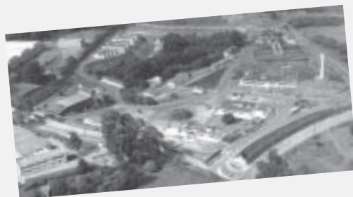
Vista aérea do local

É muito, mas ainda é muito pouco perto do que é possível fazer, considerando a estrutura do terreno e as construções já existentes da Casa do Cristo Redentor – 114 mil metros quadrados de área, 19.600 metros quadrados de área construída, com prédio para a administração, refeitório, cozinha com capacidade para fazer 1000 refeições por vez, dormitórios, biblioteca, teatro para 700 lugares, atendimento pediátrico e odontológico.