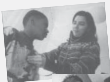
Atendimento pediátrico e odontológico